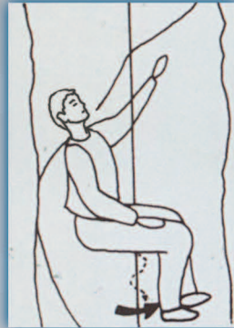
۷- موقعیت سر خوردن مطمئن