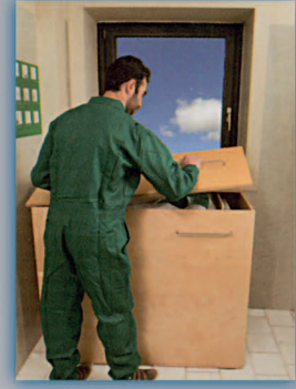
۱- ابتدا جعبه و سپس پنجره را باز کنید.