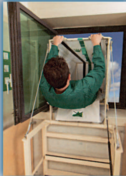
۶- بدون کفش وارد شوت شوید.