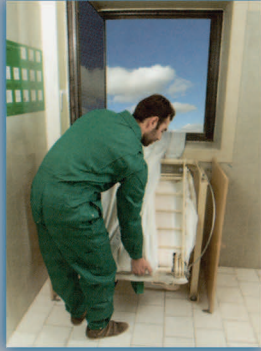
۴- قاب ورودی را به قسمت بالا بکشید.