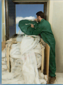
۳- کیسه پارچه‌ای را به پایین انداخته و اجازه دهید تا شوت کاملا باز شود.