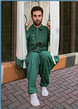
۸- شوت را به آرامی ترک کنید.