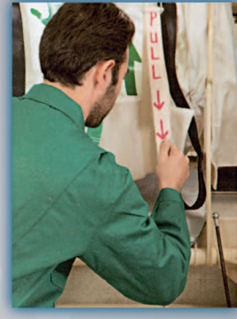
۵- کمر بند را بطرف خود کشیده و ورودی را به قسمت بالا بکشید.