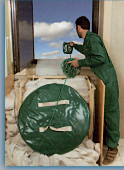
۲- قسمت محافظ پارچه‌ای و طناب راهنما را به پایین پرتاب کنید.